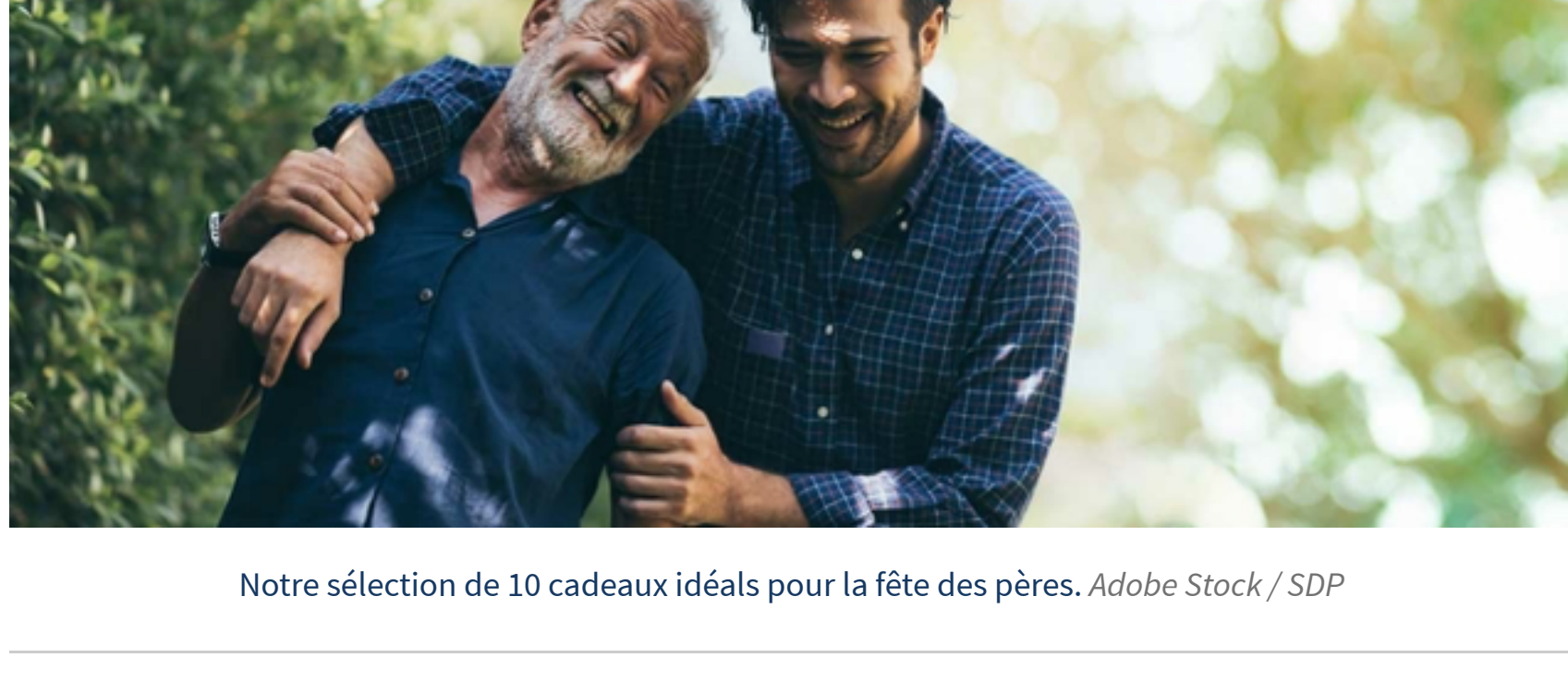
Notre sélection de 10 cadeaux idéals pour la fête des pères.

Par Jean-Pierre Sacconi Publié le 18/05/2023